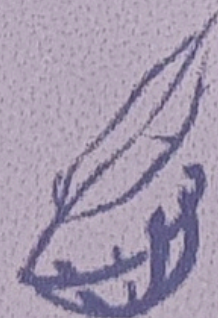
UNIDOMPEDRO CENTRO UNIVERSITÁRIO DOM PEDRO II